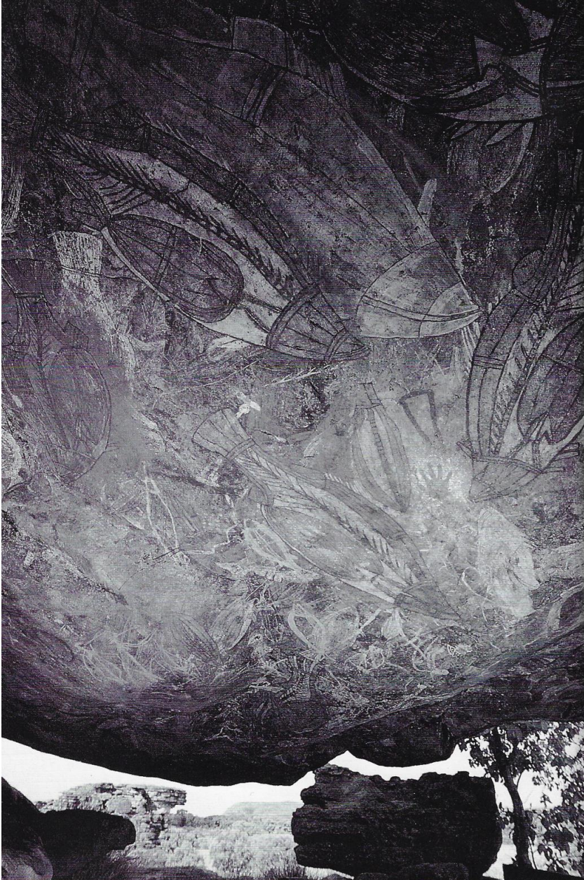
Felsmalerei der Aborigines Australiens, ca. 30.000 - 50.000 Jahre alt 3