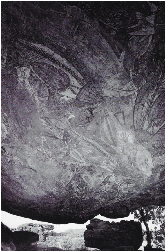
Felsmalerei der Aborigines Australiens, ca. 30.000 - 50.000 Jahre alt 3

Menschen für Menschen geschaffen. Sie war immer sozial eingebunden und hatte immer einen Auftrag für die menschliche Gesellschaft oder den Einzelnen.