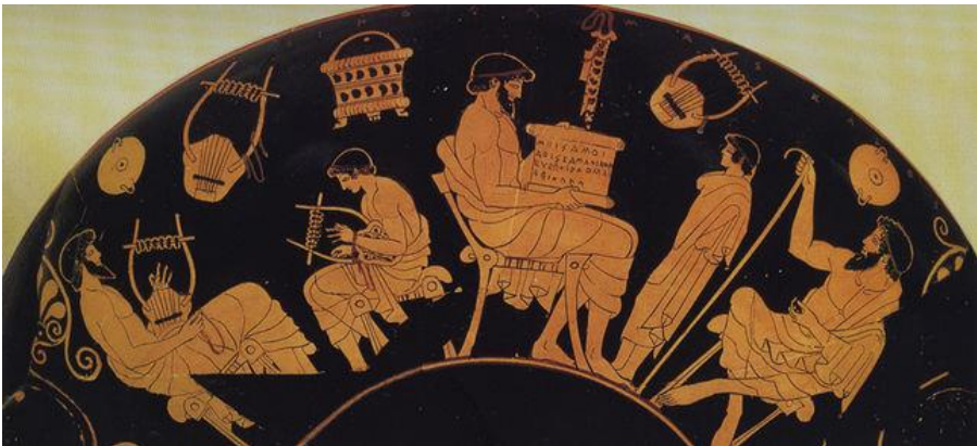
Malerei auf einer antiken griechischen Vase zur Paideia 17

Die dritte historische Wurzel der Kunsttherapie findet sich in der Paideia , der Erziehungskunst der Griechen. Die menschenbildende Wirkkraft der Künste wurde bereits seit Homers Zeiten (800 v.C.) zur Erziehung von Kindern und Jugendlichen und zur Bildung der Erwachsenen eingesetzt 15 . Kinder, Jugendliche und Erwachsene lernten Epen auswendig und rezitierten diese. Sie tanzten Reigentänze und spielten Lyra und Theater 16 . Hier ging es um die Wirkung eigenen kunstschaftenden Tuns zur Bildung des Menschen.