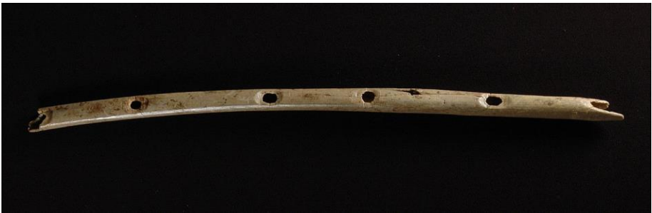
Flöte aus der Höhle Hohle Fels (Ulm). Ca. 35.000 Jahre alt.

Mit dem Begriff Schamanismus ist die Gesamtheit der Heilarbeit und Heilkunst naturverbunden lebender Völker gemeint, die es schon in der Frühzeit der Menschheit und z.T. noch Anfang des 20. Jahrhunderts in naturverbunden lebenden Völkern gegeben hat 4 .