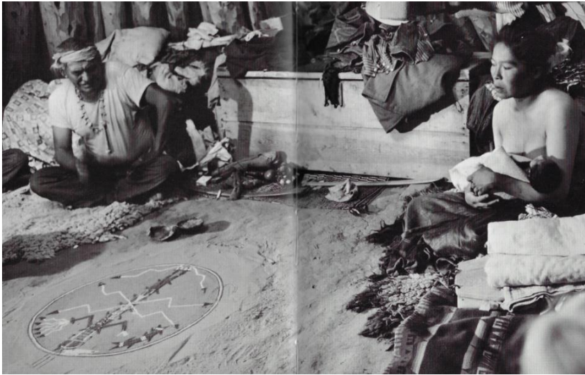
»Inneres einer Navajo-Hütte in Arizona mit rituellen Sandzeichnungen, um einem kranken Kind zu helfen.« 9

Zaubersprüche, Mantren uwm. ein 7 . Es ist naheliegend, dass die aus der Steinzeit stammenden Malereien, Zeichnungen, Trommeln, Flöten etc. in ähnlicher Weise zur Heilarbeit eingesetzt wurden. Es handelte sich um einen therapeutischen Weg, der die Gesundheit des Menschen durch dessen harmonische Wiederverbindung mit der ihm zugehörigen menschlichen Gemeinschaft und der Natur verfolgte 8 .